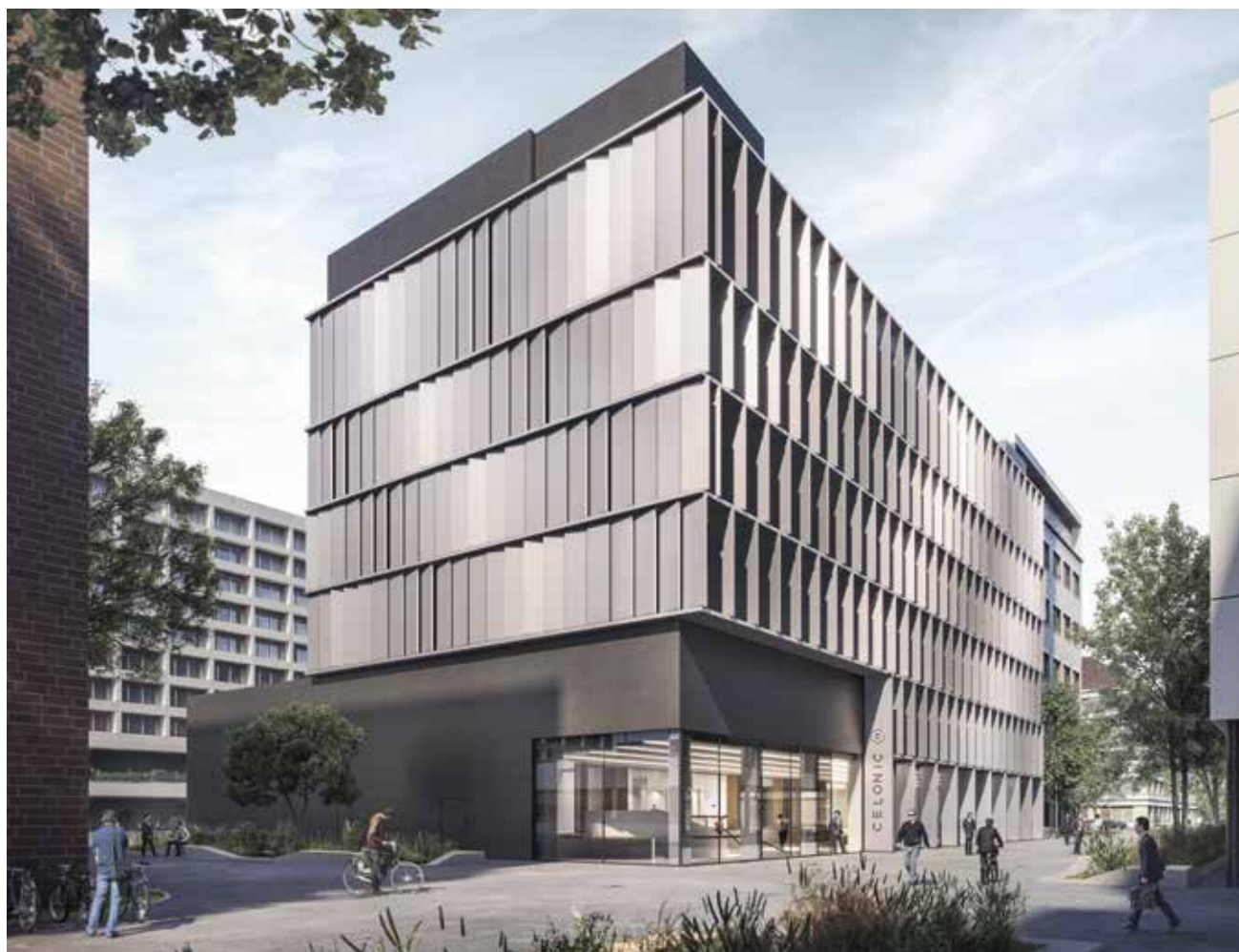
Der Zugang zum Siegerprojekt «Helix» mit seiner markanten Brise-Soleil-Fassade erfolgt über die Gebäudeecke.

H eute ist das älteste Basler Chemieareal «Rosental Mitte» noch ein hermetisch abgeschlossenes Gebiet. In den nächsten Jahrzehnten soll es sukzessive geöffnet, verdichtet und in das bestehende Quartier integriert werden. Herzog & de Meuron erarbeiteten dafür ein städtebauliches Leitbild, das der Kanton Basel-Stadt