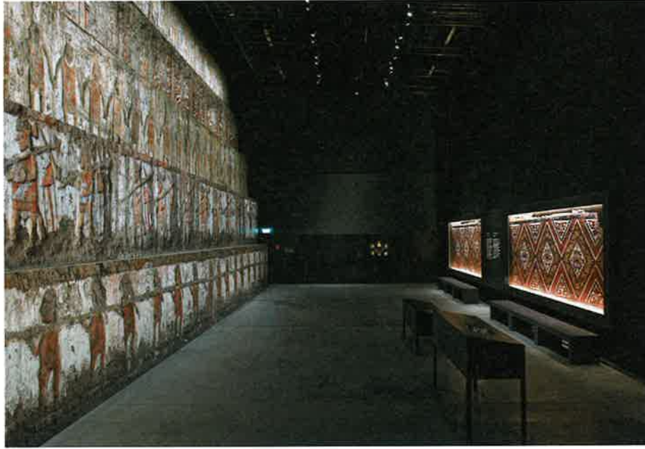
Die Sonderschau über die Mocha-Könige zeigt zum ersten Mal die phänomenalen Funde aus den Gräbern in Peru.

lungshalle dar: Die Decken und Böden des ersten Untergeschosses sind an den tragenden Querwänden aufgehängt. Diese Wände wirken als geschosshohe Träger und überspannen die darunter liegenden Ausstellungsbereiche. In gewisser Weise erahnt man die Ausdehnung der unterirdischen Erweiterung, steht man auf dem leicht erhöhten Platz oder der Esplanade. Diese spannt sich als städtischer Platz zwischen dem Eingangsgebäude zum neuen Museumskomplex und dem östlich angrenzenden Schulgebäude auf. Als Hauptelement der Esplanade nennt der Zürcher Landschaftsarchitekt Guido Hager den sinnlich gestalteten «Gartenteppich». Judasbäume und indische Lagerströmien blühen auf Pflanzeninseln,