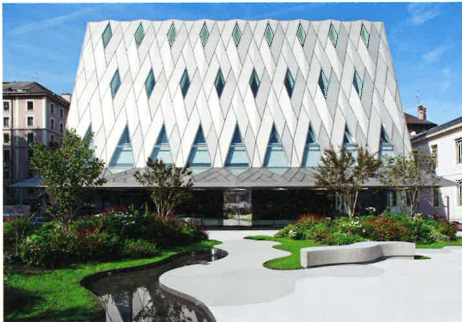
Zum parkähnlichen Platz präsentiert sich stolz die «edle» Dachhaut des Museums.